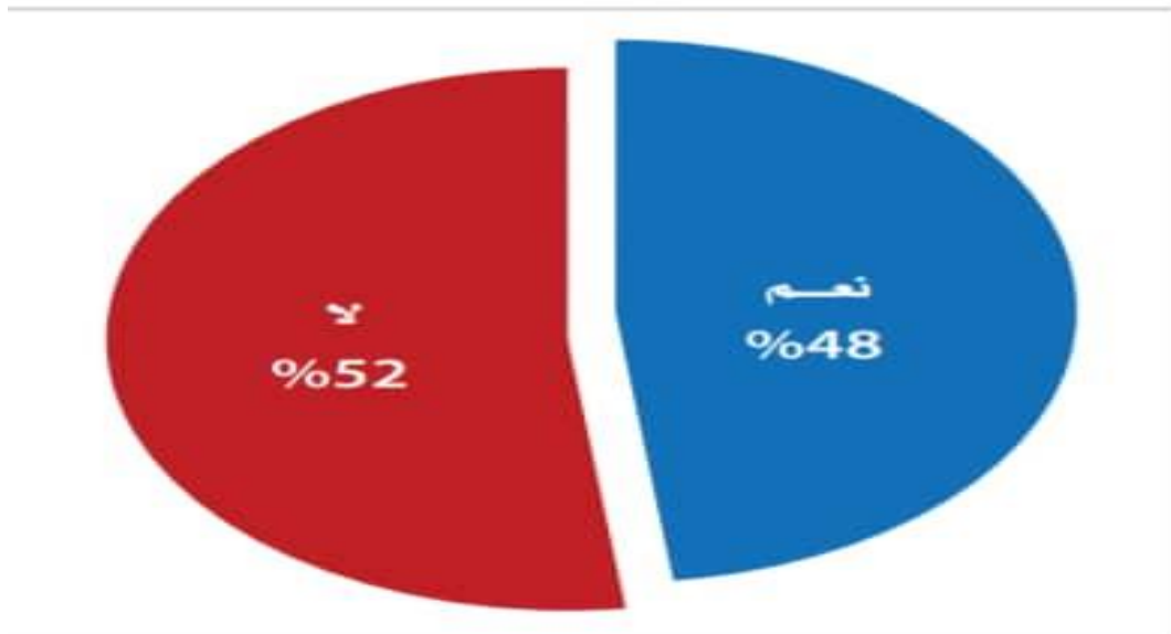
الشكل (1): شكلت المشاريع الصغيرة والأصغر مصدر الدخل الوحيد لحوالي نصف (48.3%) عينة الدراسة من عملاء التمويل الأصغر.