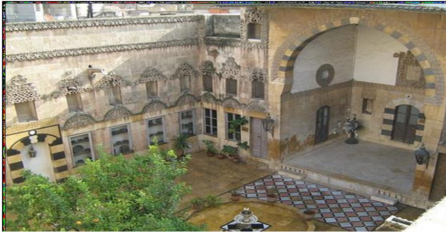
دار اجقباش ( متحف التقاليد الشعبية) الفناء والايوان

يتألف دار أجقباش من فناء واسع تتوسطه بركة ماء يتم الصعود إليه عبر درج داخلي حجري وذلك لاختلاف منسوبي الفناء والشارع، يتوزع كل من الايوان وغرف الدار الاخرى حول الفناء وتتميز الجدران المطلة على الفناء بتزيينات حجرية جميلة تعكس فن الباروك الذي انتشر في تلك الفترة.