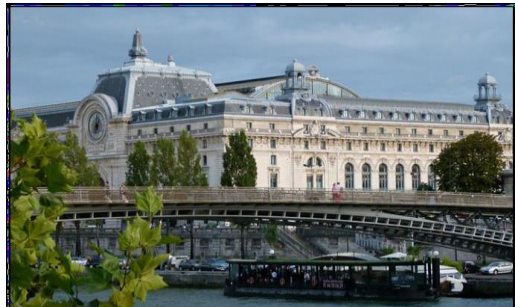
متحف اورسيه _ مبنى المتحف من الخارج

المبنى بالأصل مؤلف من قاعة مستطيلة كبيرة تضم مسار سكة القطار بالإضافة إلى الأرصفة الجانبية للمحطة. في عمليات إعادة تأهيل المبنى تم ايجاد حل نابع من الوعي بالطريقة الأسهل لحركة الناس وساعد الفراغ ذو المساحة الكبيرة والارتفاع الضخم بإعطاء المرونة للمصمم المعماري بإيجاد عدة مستويات للعرض المتحفي وهذا ماساهم في زيادة مساحة العرض المتحفي بشكل كبير.