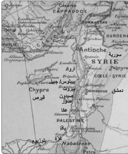
خريطة تُظهر دور الضرب البطلمية في سورية