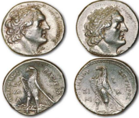
الكنز المكتشف سنة ١٩٧١ تعود من إصدار صيدون في عهد البطالمة Augé. Christian, 1989: La monnaie en Syrie à l'époque hellénistique et romaine, Archéologie et Histoire de la Syrie