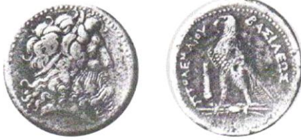
نقد برونزي كبير لبطليموس الثاني مضروب في صور في سنة ٢٨٥ - ٢٤٦ ق.م

كما حملت المسكوكات البرونزية في صور في عهد بطليموس الثاني فيلادلفيوس في مركز الوجه صورة رأس الإله زيوس/أمون، وفي مركز الظهر نقش النسر البطلمي بين مخالبه صورة حيوان الموريكس الصدفى الذي كان الفينيقيون يستخرجون منه الصبغ القرمزي، وأمام النسر نقش هراوة الإله ملقارت سيّد مدينة صور والإله الأكبر فيها مع غياب كتابة اسم المدينة أو رمز كتابي يشير إليها، لكن هراوة ملقارت وحيوان الموريكس أكدا أنّ الإصدار تمّ في صور .