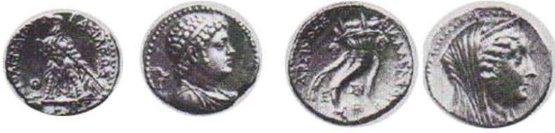
تيترادراخما فضية لبطليموس الرابع مضروب في صور من قبل بطليموس الخامس في سنة ٢٠٤ - ١٨٠ ق.م