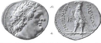
Augé. Christian, 1989: La monnaie en Syrie à l'époque hellénistique et romaine, Archéologie et Histoire de la Syrie