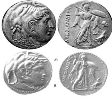
Augé. Christian, 1989: La monnaie en Syrie à l'époque hellénistique et romaine, Archéologie et Histoire de la Syrie

د- المرحلة الرابعة: شملت مسكوكات ذهبية وفضية ضربت وفق عيار مدينة رودوس، وتؤرخ بين السنوات (311/316 ق.م) و(305/311 ق.م)، وتميزت بحملها أيضاً في مركز الوجه رأس الإسكندر الكبير يعلوه قرون الإله زيوس/آمون مع جلد فيل، وفي مركز الظهر صورة أثينا بالاس مع كتابة اسم الإسكندر (ΑΛΕΞΑΝΔΡΟΥ)، وتؤرخ بين عامي (311/316 ق.م).