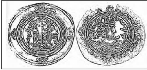
لوحة رقم (٤):

درهم المحراب والعنزة ينسب لعبدالله بن الزبير، الوزن ٣ جم ٤١ مم عرض في مزاد مؤسسة سوذبي في لندن ١٢ يوليو ١٩٩٣م، نقل عن: