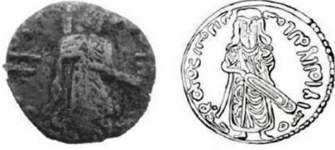
فلس عبد الملك بن مروان - الخليفة واقفاً ممسكاً بسيفه