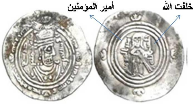
درهم صادر وفق الطراز العربي - الساساني للخليفة عبد الملك بن مروان

ضرب عبد الملك بن مروان في سنة (75هـ) درهماً عربياً - ساسانياً حمل في مركز الوجه رأس كسرى الفرس، والعبارة: (لا إله إلا الله وحده محمد رسول الله). وفي مركز الظهر صورة الخليفة واقفاً متمنطقاً سيفه، وعلى جانبيه عبارة: (أمير المؤمنين)، (خليفة الله). وتكررت هذه الصورة على الدنانير والفلوس البيزنطية، والقصد منها التحدي لإمبراطور الروم البيزنطيين 16 .