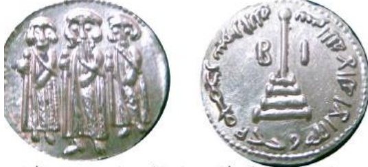
دينار بيزنطي لهرقل وأبنائه وعلى الظهر صليب محوّر بكرة أعلاه وعبارة عربية (بسم الله لا إله إلا الله وحده محمد رسول الله)

يعدّ هذا الدينار الذي أصدره الخليفة عبد الملك بن مروان السلفَ لدينار الخليفة الواقف، إذ قام الخليفة بعملية تحوير على السوليدوس الذهبي البيزنطي الذي حمل في مركز الوجه صورة الإمبراطور وولديه، ويعلو رأس كل واحد منهما صليب، فقام الخليفة بمسحها، كما قام بتحوير رأس الصليب في مركز الظهر القائم على ثلاث درجات؛ ليظهر كعمود بأعلاه كرة، وأحاطه بالكتابات الكوفية (بسم الله لا إله إلا الله وحده محمد رسول الله) 17