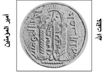
رسم المحراب والعنزة على طراز دراهم المحراب والعنزة.

أصدر عبد الملك بن مروان درهماً عربياً إسلامياً على الطراز العربي الساساني حمل في مركز الوجه رأس كسرى ملك الفرس، ويظهر السيف على مستوى صدره، وعبارة (لا إله إلا الله وحده محمد رسول الله). في حين حمل مركز الظهر صورة محراب مؤلف من قوس مستند على عمودين، وترافقه عبارة (أمير المؤمنين)، و(خليفة الله)، وفي داخل المحراب نقش عنزة، فُعرف هذا النقش: (محراب العنزة)، وجُسدت العنزة قائمة على قاعدة مزدوجة في هيئة حرف (V) مقلوب، وقائم العنزة في هيئة لواء إذ عقد عليه قماش يتدلى في هيئة شريطين متموجين إلى أسفل جهة اليسار، وتنتهي العنزة من الأعلى بنصل مدبب له طرفان جانبيين يشبهان قرني العنز، وحوله كتابة (نصر الله)، وفي الأعلى (أمير المؤمنين)، وفي الجهة اليمنى (خليفة الله). ويُفسر نقش المحراب على هذه الدراهم الكسروية للإشارة إلى قبلة المسلمين في الصلاة؛ وهي الكعبة، وقد كان المحراب في المساجد المبكرة منذ صدر الإسلام لتحديد اتجاه القبلة، وإن نقش العنزة ما هو إلا دلالة لعنزة رسول الله عليه الصلاة والسلام 19 .