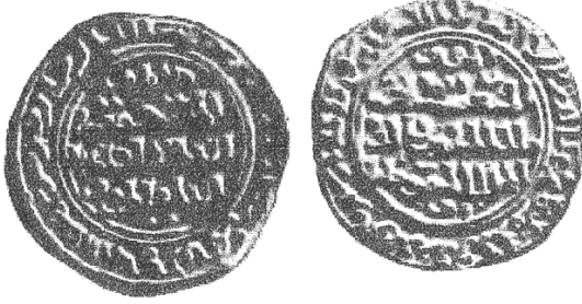
دينار شجر الدرّ - المتحف البريطاني

كما أنّ أول مرة في التاريخ العربي والإسلامي تتسلم امرأة الحكم؛ وهي شجر الدرّ التي ضربت مسكوكات بمصر حملت اسمها ولقبها: (المستعصمية الصالحية ملكة المسلمين والدة الملك المنصور خليل أمير المؤمنين). وتمّ تفسير الألقاب التي حملتها بكونها حكمت زمن الخليفة العباسي المستعصم، كما أنها زوجة الصالح أيوب، ووالدة المنصور خليل، وملكة المسلمين تحت راية العباسيين مع عدم رضا الخليفة العباسي عن حكمها كونها امرأة 5 .