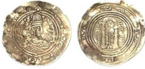
درهم المحراب الصلار وفق الطراز العربي - الساساني رمضان، عطف، ٢٠١٦: المسكوكات ودورها في التوثيق لتاريخ مكة في القرن الخمسة الأولى للهجرة، مجلة المنظومة، العدد ٤٢، السعودية