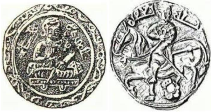
أبو الفضل جعفر المقتدر بالله العباسي (٩٠٨ - ٩٣١م). المتحف الوطني - برلين