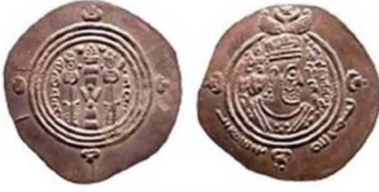
درهم صادر وفق الطراز العربي - الساساني