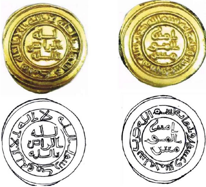
دينار الخليفة الراضي بالله

ويحتفظ المتحف البريطاني بدينار ذهبي للخليفة العباسي الراضي بالله (322-329هـ) وزنه (8,66غ)، وقطره (12مم)، يحمل الرقم المتحفى (1768)، وقد صك في سنة (325هـ). ويزيد هذا الدينار في وزنه عن الدينار العادية، وهذا يؤكد أنه من دنانير المناسبات، فقد أصدره الخليفة الراضي بالله لتخليد منصب (إمرة الأمراء)، والغاية منه استرجاع هيبة الخلافة، والسيطرة على الأوضاع السائدة، والتخلص من المشاكل السياسية للدولة، ويجزم المؤرخون أن الخليفة قد صكه لتلك المناسبة لتوافق تاريخ صك الدينار مع ما ذكره المؤرخون الأوائل حول اتخاذ هذا المنصب من قبل الخليفة، ويتوافق أيضاً مع صك دراهم الصلة للمناسبة، ونعتقد أن الخليفة قد صك أيضاً فلوساً نحاسية، وهذا جائز طالما وجدنا الدينار، وكذلك الدرهم لتكتمل الفئات النقدية الإسلامية 4 .