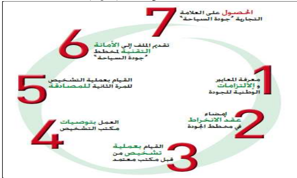
الشكل ٢ مراحل الحصول على العلامة "PQTA"