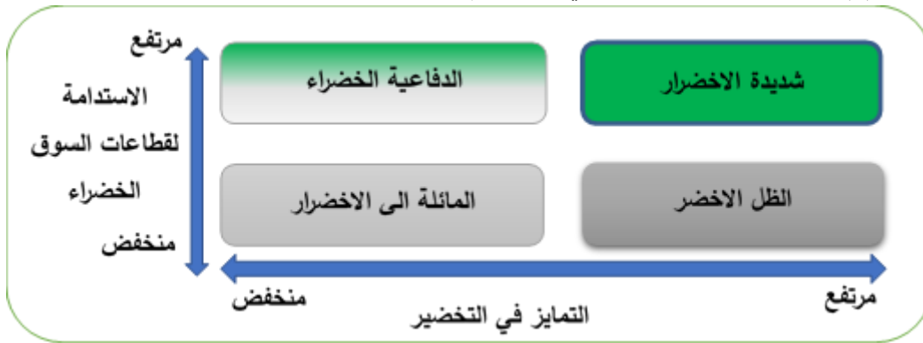
الشكل (2): مصفوفة استراتيجيات التسويق المستدام