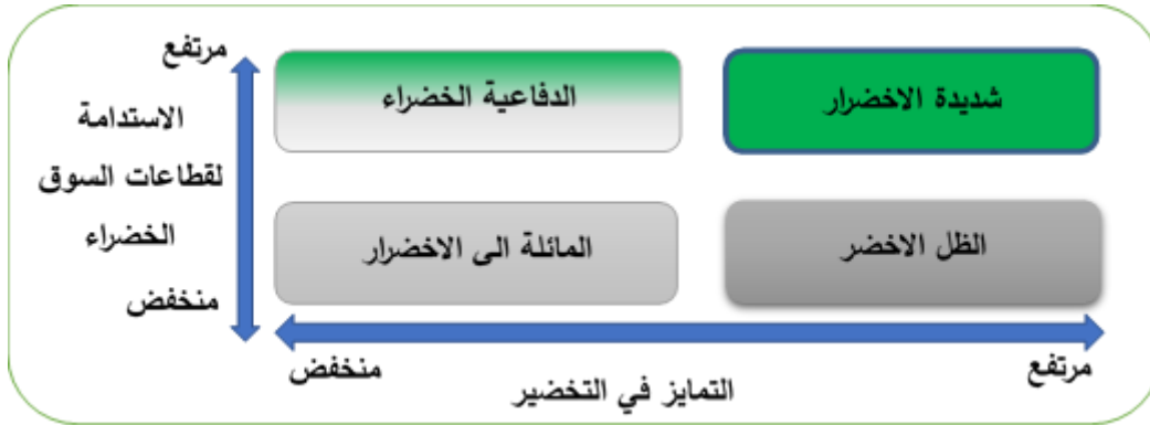
الشكل (2): مصفوفة استراتيجيات التسويق المستدام