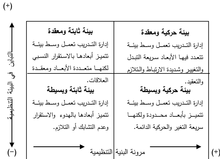
الشكل رقم (1) مصفوفة البيئة والبنية التنظيمية

وبما أن إدارة التدريب هي إحدى هذه الوحدات الفرعية داخل المنظمة، لا بد لها أن تتأثر بأي تغيير يصيب هذه البيئة، ويمكن توضيح العلاقة بين كل من (البيئة، الهيكل التنظيمي، الفاعلية الإدارية لإدارة التدريب) من خلال المصفوفة التالية [4].