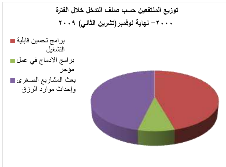
الرسم البياني - 3 -

يلاحظ من خلال الجدول أن تدخلات الصندوق خلال الفترة 2000- نوفمبر (تشرين الثاني) 2009 كانت لفائدة بعث المشروعات الصغرى وإحداث فرص العمل بنسبة 46,3%، وذلك بمنح القروض للمستثمرين الصغار ومتابعة مشروعاتهم، وبرامج تحسين قابلية التشغيل بنسبة 45,6% عبر التأهيل والتدريب وخاصة بالنسبة للفئات الصعبة الإدماج في سوق الشغل تسهيلاً لإدماجها، في حين كان التدخل ضعيفاً لفائدة برامج الإدماج في عمل مؤجر فلم تتعدَّ النسبة 8,1%، وهو من البرامج التي يستدعي الأمر إيلاءها أهمية أكبر من ذلك بكثير في ظل الإمكانيات الضعيفة لفئة الشباب بغية الاستثمار خاصة وأن نسبة هامة منهم تفضل إيجاد فرصة عمل دون تحمل أية مسؤولية يتطلبها الاستثمار.