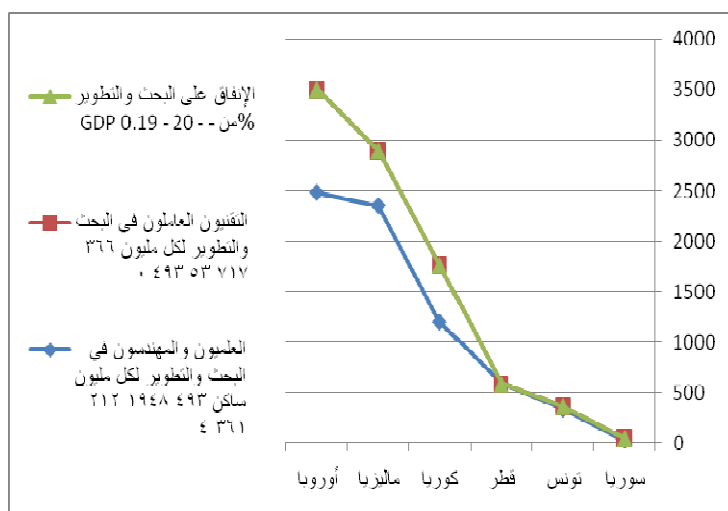
الشكل رقم (1) يبين بعض مؤشرات العلم والتقانة في بعض الدول

نلاحظ من الجدول أعلاه انخفاض نسبة الإنفاق على البحث والتطوير من الناتج المحلي الإجمالي لسورية مقارنة بدول المقارنة وهذا مايفسر غياب عمليات البحث والتطوير وبالتالي ضعف التنافسية في مؤسساتنا الاقتصادية. ويمكن توضيح ذلك بالشكل التالي :