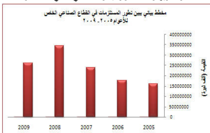
الشكل رقم (3) يبين تطور المستلزمات في القطاع الصناعي الخاص للأعوام 2005-2009

❖ تطور المستلزمات في القطاع الصناعي الخاص: من واقع القطاع الصناعي الخاص في سورية , نرى تطور المستلزمات الصناعية نتيجة زيادة نسبة الاستثمار في القطاع الصناعي، ونتيجة تغير وسائل الإنتاج عن طريق اختراع طرق جديدة نتيجة البحث والتطوير ونقل التكنولوجيا وخاصة في عامي 2008 و2009.