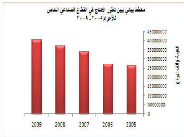
الشكل رقم (2) يبين تطور الإنتاج في القطاع الصناعي الخاص للأعوام 2005-2009

المصدر : المكتب المركزي للإحصاء - المسح الصناعي لعام 2009