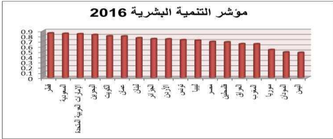
الشكل (2): مؤشر التنمية البشرية في الدول العربية لعام 2016

بالاضافة الى الفروقات في قيم مؤشر التنمية البشرية بين الدول العربية. حيث أن مؤشر التنمية البشرية هو مقياس مقارن لمتوسط العمر المتوقع ، ومحاولامية والتعليم ومستويات المعيشة بالنسبة للبلدان في جميع أنحاء العالم بل هو وسيلة لقياس مستوى الرفاه، والرعاية الاجتماعية. يستخدم المؤشر للتمييز بين ما إذا كان البلد بلد متقدم، أونامي أوامن البلدان الأقل نمواً، وكذلك لقياس أثر السياسات الاقتصادية على نوعية حياة الافراد (الموارد البشرية). هذه قائمة الدول العربية حسب صندوق التنمية الإنساني مرتبة ترتيباً تصاعدياً وفق الشكل التالي: