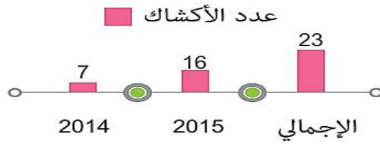
الشكل (3) عدد الأكشاك

بدأت شركة سيريئل ببرامج إعادة التدوير والاستخدام منذ عام 2010، إذ أطلقت حملة لإعادة تدوير الورق، ووضعت صناديق تجميع في مكاتب الشركة جميعها، وأفيد منها لدعم الجمعيات الخيرية. وقد توقفت هذه الحملة في عام 2012 نتيجة عدم توافر المعامل المخصصة للتدوير. واستمراراً في تقليل استهلاك الورقيات أعيد تصميم الفواتير لتطبع على صفحة واحدة بدلاً من صفحتين. وقد أدت هذه المبادرة إلى تقليص استهلاك الورق في سيريئل بمقدار 5.92 طناً بهدف تخفيف استهلاك الورق، إذ أرسلت الفواتير عبر الرسائل القصيرة SMS في مطلع عام 2014، كما طرّح ما يسمى جهاز الخدمة الذاتية "تقنية الدفع عن طريق الأكشاك Payment through Kiosks". ويوضح الشكل (3) عدد الأكشاك.