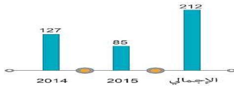
الشكل (2) نمو المدخرات في سيريئل

ت. البطاريات سريعة الشحن: Fast Charge Batteries واكبت الشركة التطور التقني لمدخرات الطاقة عبر استخدام البطاريات عالية الشحن التي تساعد على تحقيق الاستمرار من الشبكة والحد من الحمل، وتخفيف الانبعاثات. ويبين الشكل (2) نمو المدخرات في الشركة