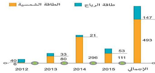
الشكل (1) نمو عدد المحطات التي تعمل على الطاقات المتجددة

ب. إدخال الطاقات المتجددة: Introducing Renewable Energy أي إدخال الطاقة الشمسية وطاقة الرياح، فضلاً عن الطاقات الهجينة Hybrid Energy لتأمين استمرارية التغطية للزبائن. وكُنْفَ العمل من أجل متابعة تزويد الشبكة بالطاقات المتجددة والبديلة بآخر ما توصلت إليه التقنيات في صناعة الألواح الشمسية ذات الكفاءات العالية والعنفات الهوائية السريعة بأقل مستوى ضجيج لتصل نسبة المحطات العاملة على الطاقات المتجددة مع نهاية عام 2015 نحو 21% من إجمالي المحطات، وبنسبة توفير من 30 % إلى 50 % من الطاقة الكهربائية. ويوضِّح الشكل (1) نمو عدد المحطات التي تعمل على الطاقات المتجددة.