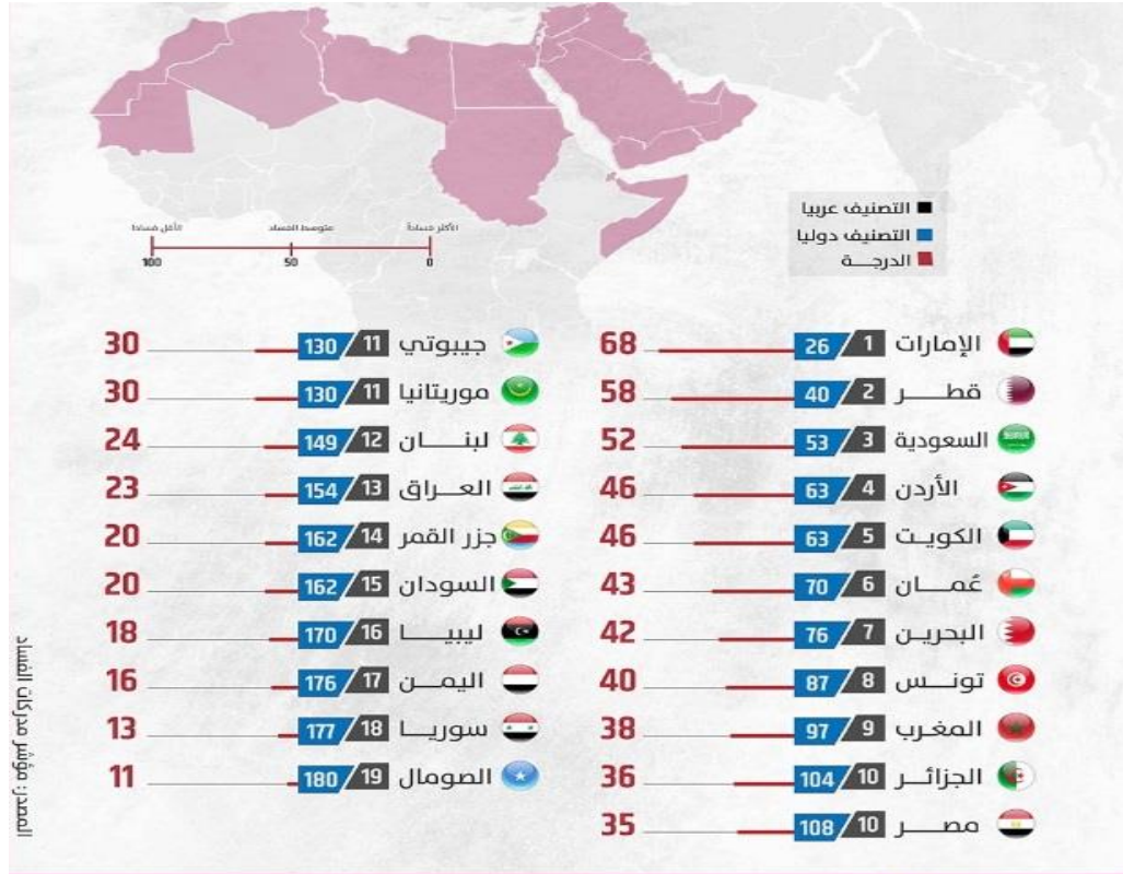
شكل (١) "ترتيب ودرجات الدول العربية على مؤشر مدركات الفساد لعام ٢٠٢٣"

هذه النخبة الى الحكم كما في بعض الدول المتقدمة، وهذا ما سيمتعم بالحصانة البرلمانية وتأثيرهم الكبير في كافة القرارات، مما سيؤدي الى حدوث حالة من الازباج المحلي تجاوز سلطة القانون (سلمان و ميخا ، ٢٠٠٧، ٢٢٧)، ومن خلال الشكل رقم (١) يمكن ملاحظة قيم مؤشر مدركات الفساد للعراق وترتيبه العالمي والعربي ، اذ يعتمد المؤشر في تصنيفه ومنح الدرجات لـ ١٨٠ دولة، على (١٣) مصدراً للمعلومة، والتي تعدها مؤسسات عالمية متخصصة وغير حكومية، حيث يتم احتساب الدرجات ما بين (٠) إلى (١٠٠) درجة، وكلما اقتربت الدرجة إلى الـ ١٠٠ كانت الدولة أقل فساداً. حيث حصل العراق على (٢٣) درجة من (١٠٠) وجاء في المركز (١٥٤) عالمياً والمرتبة (١٣) عربياً ، وقد حقق العراق عموماً تطوراً بطيئاً في معيار مكافحة الفساد، ويعود ذلك إلى أن "الوضع السياسي" ما زال متردياً. على هذا المستوى تفتيحاً وطائفيّاً فضلاً عن الوضع الأمني الهش الذي ما زال غير مستقر بوجود تنظيم «داعش» (إبراهيم، ٢٠٢٤، ٥٧٥) ، وهذا له انعكاس سلبي على كل المؤشرات التي يعتمدها التقرير، وجاءت الإمارات في المرتبة الـ ٢٦ عالمياً والأولى عربياً على "مؤشر مكافحة الفساد"، تلتها قطر في المرتبة الـ ٤٠ عالمياً، وتذيلت "الصومال وسوريا واليمن وليبيا القائمة".