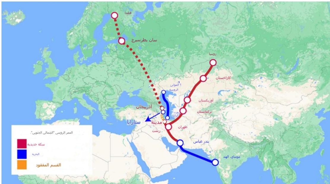
خارطة الممر الروسي الشمالي الجنوبي

على الرغم من ان جذور هذا المشروع تعود بتاريخها الى قرابة عقدين مضت، الا ان الممر الدولي للنقل بين الشمال والجنوب والذي يسعى الى انشاء خط نقل من الهند مروراً بإيران وصولاً الى روسيا عاد الى الواجهة في خلال العامين الماضيين. ويعود السبب وراء زيادة اهتمام كل من روسيا وإيران بتفعيل ممر دولي يربط الهند بآسيا الوسطى وروسيا الى للعقوبات الغربية المفروضة على روسيا والتي أعقبت الغزو الروسي لأوكرانيا في شهر شباط من العام ٢٠٢٢ بالإضافة الى العقوبات الغربية المفروضة على إيران (جزيرة نت ٢٠٢٢). يغطي مشروع الممر الدولي للنقل بين الشمال والجنوب يمتد بطول ٧٢٠٠ كلم، بهدف تسهيل نقل الحمولات التجارية بين أفغانستان وأرمينيا وأذربيجان وروسيا ووسط اسيا واوربا والهند وإيران. وتوفر شبكة الممرات البحرية والموانئ وسكك الحديد التابعة للمشروع والتي تربط مدينة مومباي بمدينة سان بطرسبرغ مروراً بميناء تشابهار الاستراتيجي. ويتوقع ان يقلل هذا المشروع من وقت النقل بنسبة ٤٠ بالمائة، من حوالي شهرين الى قرابة الشهر، ويتزامن ذلك مع خفض في كلف النقل بنسبة ٣٠ بالمائة عند مقارنتها بتكاليف الشحن عن طريق قناة السويس (Amir2023).