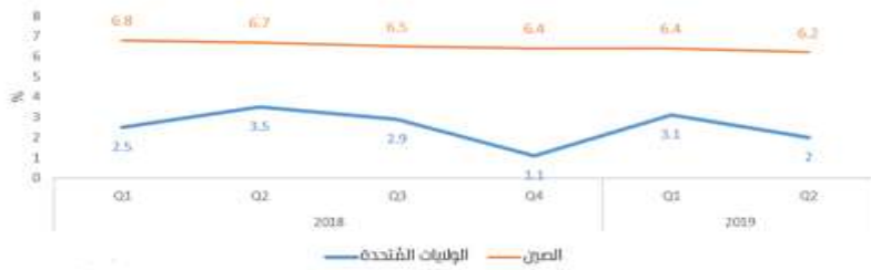
الشكل رقم (5) معدل النمو (الصين والولايات المتحدة)

بنسبة 3.1% على أساس سنوي إلى 87.5 مليار دولار (27) ، كما تراجع الأرباح الصناعية في الصين منذ النصف الثاني من عام 2018، مع تأجيل العديد من الشركات لقرارات العمل وتقليص الاستثمار الصناعي؛ إذ تباطأ النمو الاقتصادي في الربع الثاني من عام 2019 إلى أدنى مستوى خلال 30 عاماً. وانخفضت أرباح الأشهر الستة الأولى بنسبة 2.4% عن العام 2018 إلى 2.98 تريليون يوان، مقارنة بانخفاض 2.3% في عام 2019 (28) .