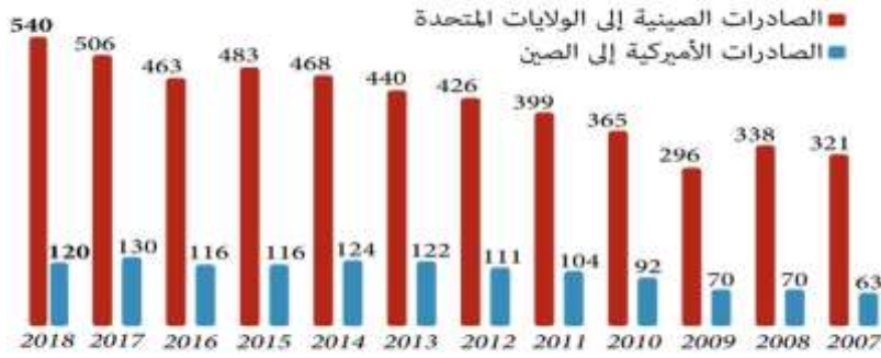
الشكل رقم (2) تجارة السلع بين الولايات المتحدة والصين بمليارات الدولارات