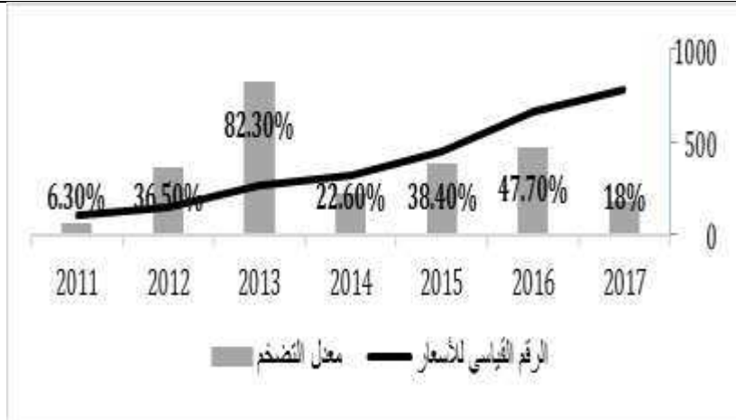
الشكل (2): الرقم القياسي لأسعار المستهلك ومعدل التضخم خلال الفترة 2011-2017

مصدر البيانات: المكتب المركزي للإحصاء، أسعار 2010 سنة الأساس