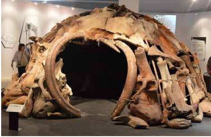
(شكل: 6) – إعادة تركيب لمسكن من عظام الماموث – العصر الحجري القديم الأعلى – روسيا

Yirka, B., Neanderthal homemade of mammoth bones discovered in .Ukraine, 19 December 2011