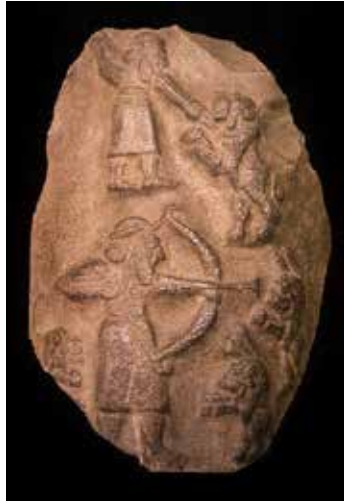
(شكل:11) - مسلة صيد الأسود - بلاد الرافدين - بداية الألف الثالث ق.م

عبد الحلیم نور الدين، الفن المصري القديم، مكتبة الاسكندرية، صفحة مصريات، 2010، ص 6.