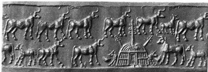
(شكل:8) - منظر لحيوانات تحيط بمنزل بدائي- ختم أسطواني - حضارة جمدة نصر