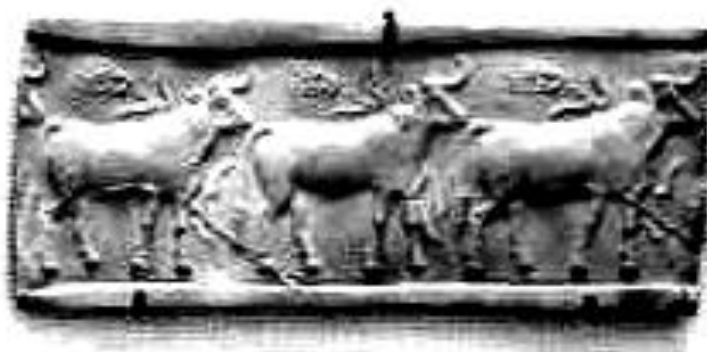
(شكل:13) - ختم أسطواني من حجر اللازورد يعلوه عجل من الفضة – الوركاء 3200

محمد عبد الحلیم نور الدين، الفن المصري القديم، ص 69 – 70.