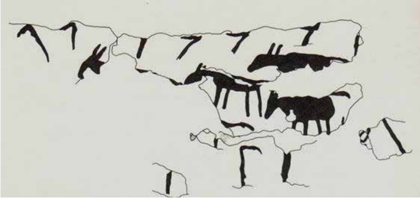
(شكل:3) - مجموعة من الصيادين يحاولون الإيقاع بقطيع من الحمير - أم الدباغية

ميروسلاف بارتا، رحلة إلى الخلود، مقابر الأفراد بالدولة القديمة، مترجم، جمهورية التشيك، 2013، ص 45.