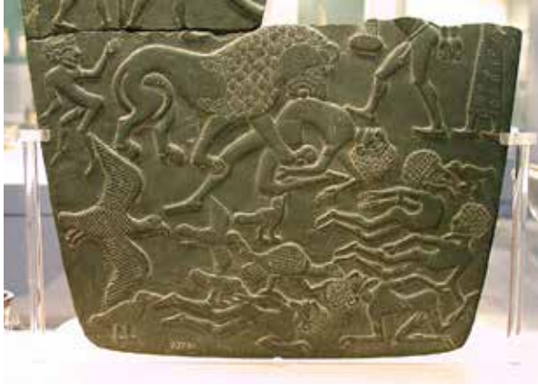
(شكل:10) - صلاية ساحة القتال أو الأسد والأعداء - بأبيدوس

عبد الحلیم نور الدين، الفن المصري القديم، مكتبة الاسكندرية، صفحة مصريات، 2010، ص 6.