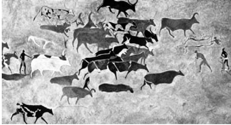
(شكل:1) - رسوم صخرية تبيّن منظر الصيد الجماعي للحيوانات البرية - 8000 ق.م بالصحراء الكبرى

.Kalof, L., Looking at Animals in Human History, London, 2007, p.8