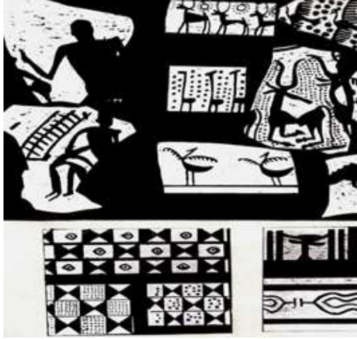
(شكل:4) - مناظر زخرفية لحيوانات الرعي في بلاد الرافدين – مرحلة حلف

عبد الحميد فاضل البياتي، تاريخ الفن العراقي القديم، كلية الفنون الجميلة، جامعة بابل، 2013، شكل 20.