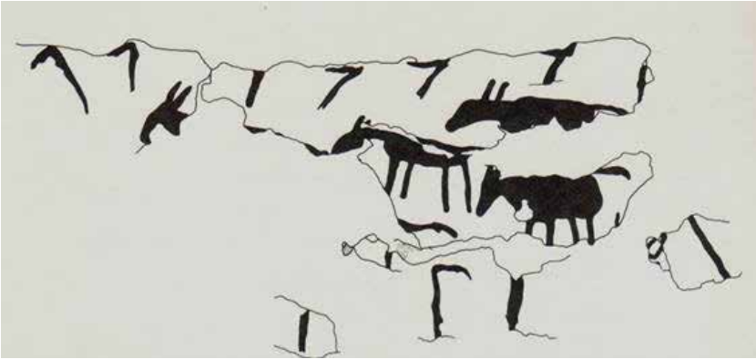
(شكل:3) - مجموعة من الصيادين يحاولون الإيقاع بقطيع من الحمير - أم الدباغية

ميروسلاف بارتا، رحلة إلى الخلود، مقابر الأفراد بالدولة القديمة، مترجم، جمهورية التشيك، 2013، ص 45.