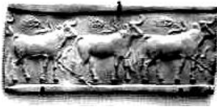
(شكل:5) - منظر الحيوانات من طبعة ختم تورخ بحضارة الوركاء

عبد الحميد فاضل البياتي، تاريخ الفن العراقي القديم، كلية الفنون الجميلة، جامعة بابل، 2013، شكل 20.