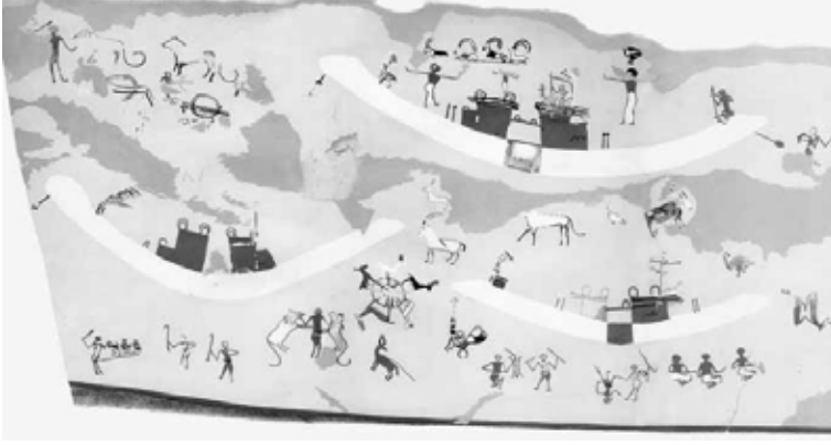
(شكل:2) - رسم جداري من المقبرة رقم 100L في هيراكونبوليس لمناظر الصيد

ميروسلاف بارتا، رحلة إلى الخلود، مقابر الأفراد بالدولة القديمة، مترجم، جمهورية التشيك، 2013، ص 45.