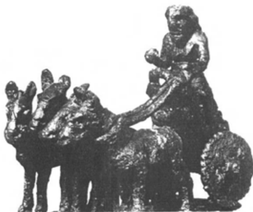
(شكل:9) - عربة تجرها ثلاثة من الحمير - تل أجزب - العراق - عصر الأسرات المبكرة

بهنام أبو الصوف، المشكلة السومرية، دراسة من خمسة أجزاء، عصور ما قبل التاريخ (2900 – 5600 ق.م)، مقالة الكترونية، 18/5/2014.