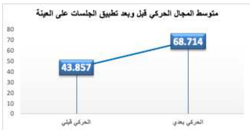
الجدول (13) اختبار ويلكوكسون للترتيب Wilcoxon Signed Ranks Test للتعرف على القيمة الاحتمالية وحجم الأثر في المجال الحركي