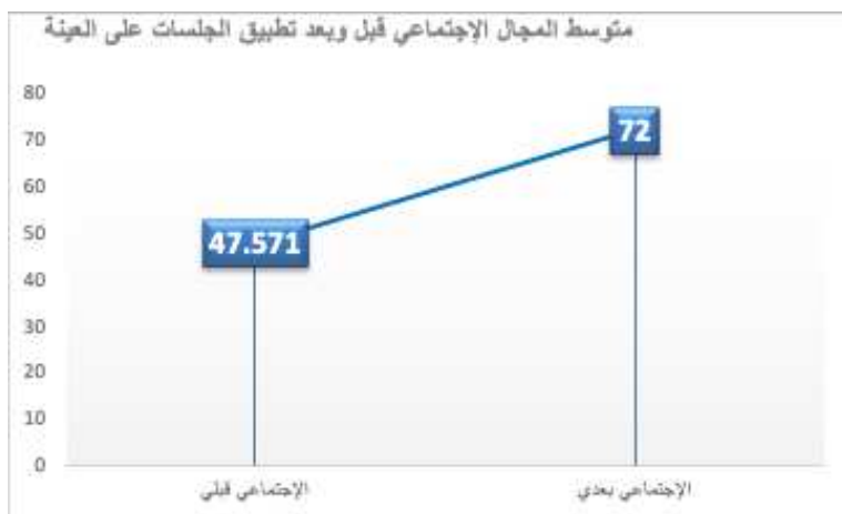
الجدول (9) اختبار اختبار ويلكوسون للرتب Wilcoxon Signed Ranks Test للتعرف على القيمة الاحتمالية وحجم الأثر في المجال الاجتماعي