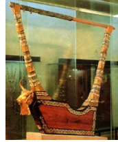
(شكل رقم 61)

https://www.cng-coins.com/Coin.aspx?CoinID=51480