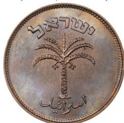
(شكل رقم 30)

https://www.ngccoin.com/price-guide/world/israel-100-pruta-km-14-5709-1949-5715-1955-cuid-1201471-duid-1473050