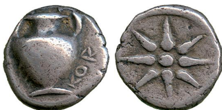
( شكل رقم 52 )

https://www.pinterest.com/pin/473792823283417656