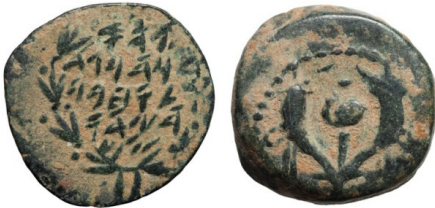
(شكل رقم 26)

https://www.vcoins.com/en/stores/apollo_numismatics/12/product/judaea_hasmonean_dynasty_judah_aristobulus_i_ae_pru-tah_legenddouble_cornucopia_pomegranate_rare_early_type/599673/Default.aspx