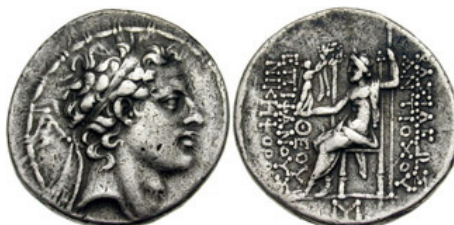
(شكل رقم 29)

http://www.wildwinds.com/coins/greece/seleucia/antiochos_IV/BMC_21.jpg