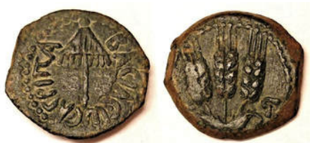
(شكل رقم 36)

http://www.ancientcoin-age.org/coins-of-the-herodians--roman-procurators.html