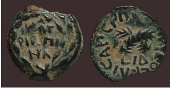
(شكل رقم 64)

http://www.akropolis-coins.com/page5.html