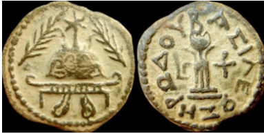
( شكل رقم 48 )

http://www.coinsweekly.com/en/Archive/New-Exhibition-of-the-ANS-at-the-Fed-Coins-of-the-Holy-Land/8?&id=600&type=n