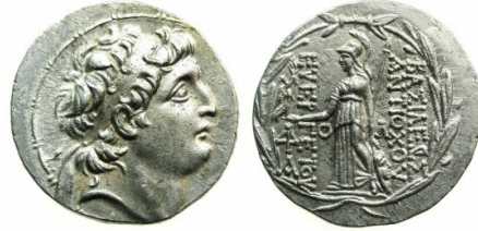
(شكل رقم 27)

https://www.vcoins.com/en/stores/pavlos_s_pavlou_numismatist/131/product/seleucid_empiresyriaantiochus_vii_138129_bcartetradrachmmint_of_antioch/638402/Default.aspx