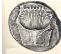
(شكل رقم 59)

http://www.ancientlyre.com/the_biblical_kinnor