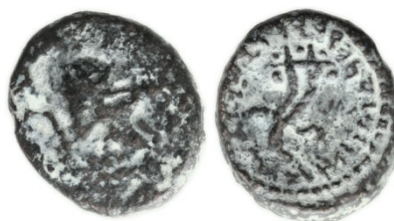
( شكل رقم 49 )

https://www.numisbids.com/n.php?p=lot&sid=325&lot=20053