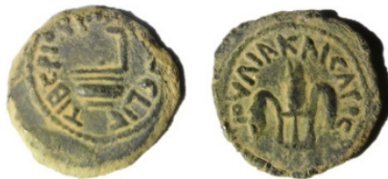
(شكل رقم 35)

http://www.ancientcoin-age.org/coins-of-the-herodians--roman-procurators.html