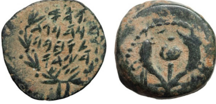
(شكل رقم 26)

https://www.vcoins.com/en/stores/apollo_numismatics/12/product/judaea_hasmonean_dynasty_judah_aristobulus_i_ae_pru-tah_legenddouble_cor-nucopia_pomegranate_rare_early_type/599673/Default.aspx