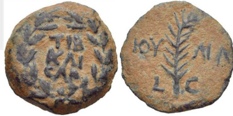
(شكل رقم 21)