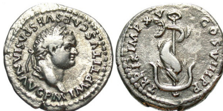
(شكل رقم 7)

https://www.beastcoins.com/RomanImperial/II/Titus/Z7630.jpg