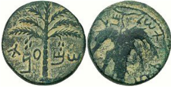
(شكل رقم 24)

http://www.forumancientcoins.com/catalog/roman-and-greek-coins.asp?vpar=1189&pos=0&sold=1