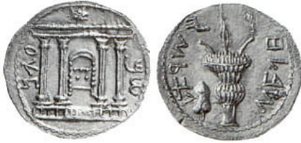
(شكل رقم 56)

http://coinquest.com/cgi-bin/cq/coins?main_coin=14998