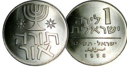
(شكل رقم 53)

http://coinquest.com/cgi-bin/cq/coins?main_coin=14998