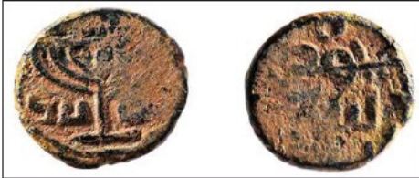
(شكل رقم 44)

https://www.pressreader.com/usa/the-jewish-voice/20171215/281861528851477