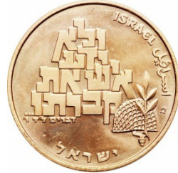
( شكل رقم 47 )

https://colnect.com/he/coins/coin/15999-100_Lirot_21st_Anniversary_of_Independence-1958~1980_-_D7%99%D7%9E%D7%99_%D7%A2%D7%A6%D7%9E%D7%90%D7%95%D7%AA%D7%99%D7%A9%D7%A8%D7%90%D7%9C