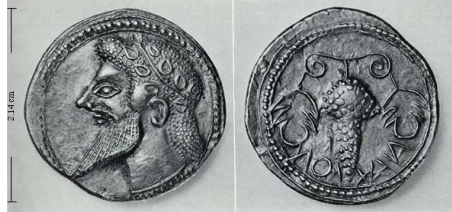
(شكل رقم 65)

https://hogshead-wine.files.wordpress.com/2011/04/sicily_naxos_drachm_525_510bc.jpg