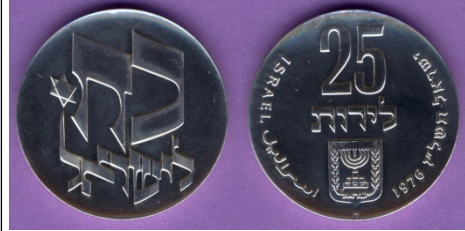
(شكل رقم 57)

http://swapmeetdave.com/Coins/Israel/KM85-1976-proof.jpg