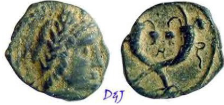
(شكل رقم 37)

http://www.wildwinds.com/coins/greece/arabia/nabataea/Meshorer_058.jpg