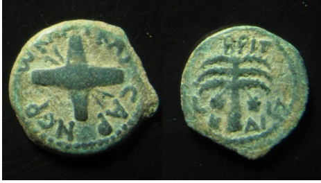
(شكل رقم 32)

https://www.vcoins.com/en/stores/shick_coins/202/product/judaea_antonius_felix_procurator_ae_prutah_year_14_54_ad_full_legend/549416/Default.aspx