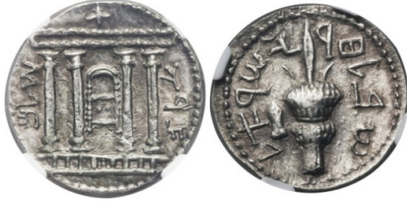
(شكل رقم 54)

http://www.numisbids.com/n.php?p=lot&sid=611&lot=23821