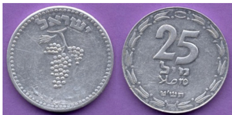
(شكل رقم 10)

http://swapmeetdave.com/Coins/Israel/KM8-1949.jpg