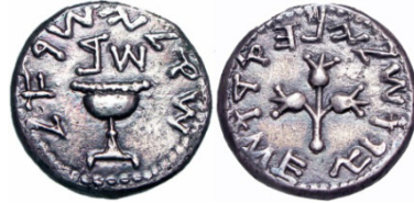
(شكل رقم 39)

https://www.vcoins.com/en/stores/athena_numismatics/18/product/judaea_first_jewish_war_shekel_year_2_67_ce/494478/Default.aspx