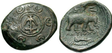
(شكل رقم 66)

https://www.cointalk.com/threads/post-your-seleukids.278705