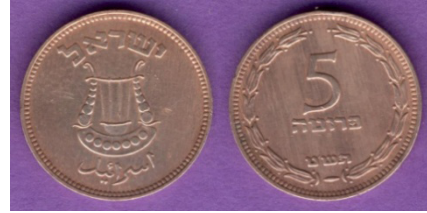
(شكل رقم 13)

http://swapmeetdave.com/Coins/Israel/KM10-1949.jpg