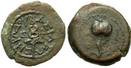
(شكل رقم 40)

https://www.forumancientcoins.com/catalog/roman-and-greek-coins.asp?param=26930q00.jpg&vpar=925&zpg=26168&fld=https://www.forumancientcoins.com/Coins