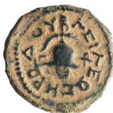
( شكل رقم 51 )

http://www.jewishvirtual-library.org/herod-the-great-s-coins