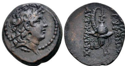
( شكل رقم 50 )

http://www.wildwinds.com/coins/greece/seleucia/tryphon/Houghton_259.jpg