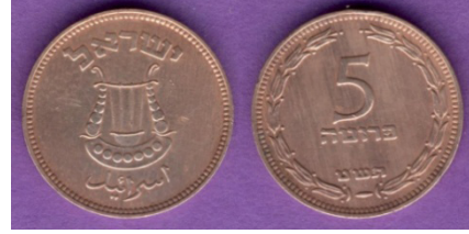
(شكل رقم 13)

http://swapmeetdave.com/Coins/Israel/KM10-1949.jpg