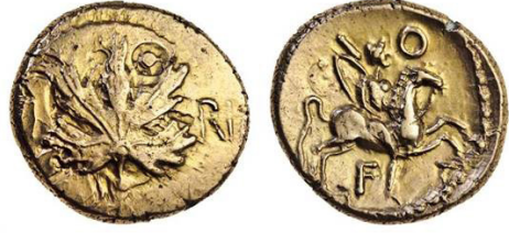
(شكل رقم 25)

https://www.the-sale-room.com/en-gb/auction-catalogues/spink/catalogue-id-srspi10053/lot-9e959554-3881-427c-9b4a-a4bf00bbb61d