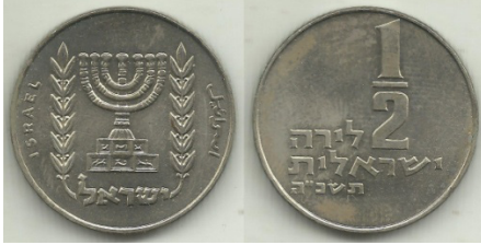
(شكل رقم 42)

http://swapmeetdave.com/Coins/Israel/KM36-1-1965.jpg