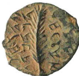
(شكل رقم 19)

http://www.muenze-und-macht.at/coins/coin3_2A?language=en