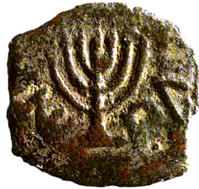
(شكل رقم 43)

https://commons.wikimedia.org/wiki/File:Ancient_Menorah_Coin.gif