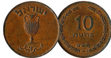
(شكل رقم 15)

http://coinquest.com/cgi-bin/cq/coins?main_coin=11440