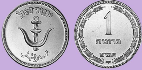
(شكل رقم 4)

http://swapmeetdave.com/Coins/Israel/KM9-1949.jpg