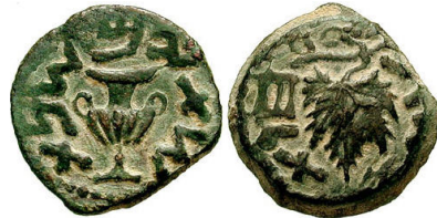
(شكل رقم 23)

http://www.zionism-israel.com/dic/Jewish_Revolt.htm