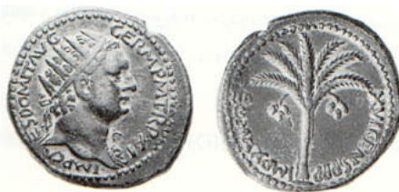
(شكل رقم 33)

http://www.swapmeet-dave.com/Coins/Israel/KM15a-1949.jpg