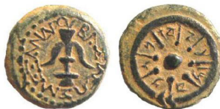
(شكل رقم 9)

http://www.uhl.ac/sabbatical-year-coins-alexander-jan-naeus