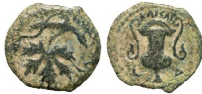
(شكل رقم 67)

https://www.vcoins.com/en/stores/apollo_numismatics/12/product/judaea_valerius_gratus_roman_prefect_under_tiberius_ae_prutah_vine_leafkantharos/592462/Default.aspx