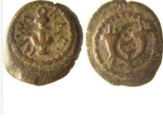
(شكل رقم 12)

https://www.google.ps/search?q=herod+the+great+coins+anchor&source=lnms&tbm=isch&sa=X&ved=0ahUKEwiVjPqLnODZAhWDyaYKHV6LCOoQ_AUICigB&biw=1366&bih=588#imgcr=y4-dysVWa9T5xM