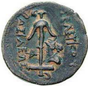
(شكل رقم 2)

https://www.google.ps/search?biw=1366&bih=637&tbm=isch&sa=1&ei=pfGjWu7UJcGOsgGwtKDYBg&q=Seleukos+II+coins+anchor+&oq=Seleukos+II+coins+anchor+&gs_l=psy-ab.3...190539.192062.0.196133.9.9.0.0.0.263.1079.0j2j3.5.0...0...1c.1.64.psy-ab..6.0.0...0.dX6mfMNqxn8#imgrc=H55beykC :BENopM