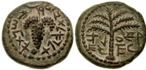
(شكل رقم 6)

https://www.ngccoin.com/news/article/2494/The-Coinage-of-Bar-Kokhba/#group-6