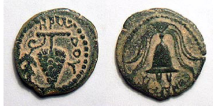
(شكل رقم 5)

http://www.wildwinds.com/coins/greece/judaea/herod_archelaus/i.html