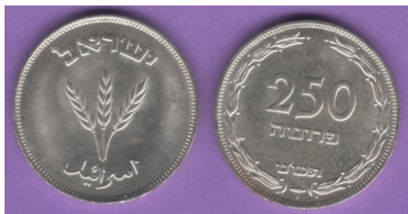
(شكل رقم 34)

http://www.swapmeet-dave.com/Coins/Israel/KM15a-1949.jpg