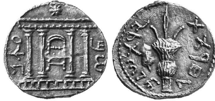
(شكل رقم 55)

http://www.romancoins.info/VIC-Buildings.html