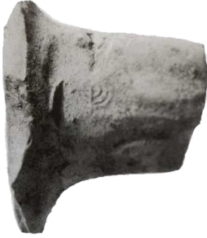
( شكل رقم 46 )

http://segulamag.com/en/news/whats-jewish-menorah-early-islamic-coins-vessels