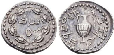
(شكل رقم 16)

https://www.numisbids.com/n.php?p=lot&sid=796&lot=23058