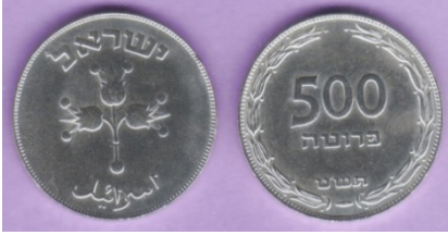
(شكل رقم 38)

http://www.swapmeedave.com/Coins/Israel/KM16-1949.jpg