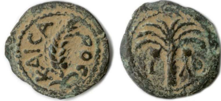
(شكل رقم 31)

http://www.wildwinds.com/coins/greece/judaea/marcus_ambibulus/i.html