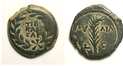
(شكل رقم 28)

http://www.wildwinds.com/coins/greece/judaea/valerius_gratus/Hendin_646v.jpg