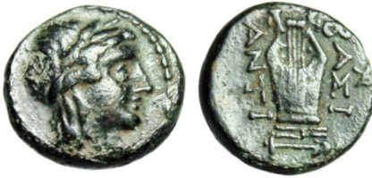
(شكل رقم 60)

https://www.ebay.com/itm/Antiochus-II-Theos-AE11-Apollo-BASIS-ANTI-Kithara-Lyre-Extremely-Rare-gVF-/183058270035