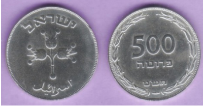
(شكل رقم 38)

http://www.swapmeettave.com/Coins/Israel/KM16-1949.jpg