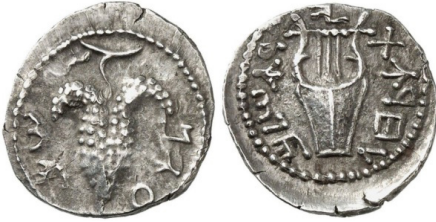
(شكل رقم 14)

https://www.vcoins.com/en/stores/sergey_nechayev_ancient_coins/200/product/bar_kokhba_revolt_jerusalem_132_ad_second_jewish_war_adlyre_grapes/594065/Default.aspx