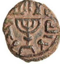
( شكل رقم 45 )

http://www.coinsweekly.com/en/Archive/New-Exhibition-of-the-ANS-at-the-Fed-Coins-of-the-Holy-Land/8?&id=600&type=n