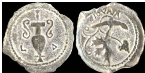
(شكل رقم 8)

http://www.fontanillecoins.com/archives_2012.htm