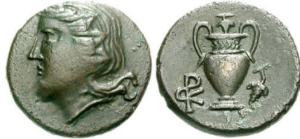
(شكل رقم 63)

https://www.cng-coins.com/Coin.aspx?CoinID=114562