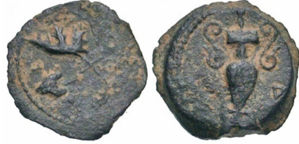
(شكل رقم 17)

https://www.coin-archives.com/18f306b37df2a750741d0645fb9751cf/img/agora/57/image00078.jpg