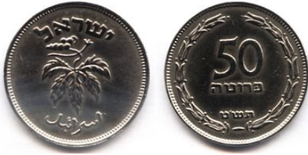
(شكل رقم 22)