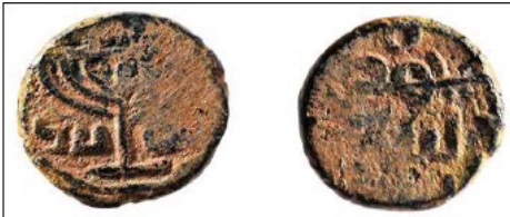
(شكل رقم 44)

https://www.pressreader.com/usa/the-jewish-voice/20171215/281861528851477