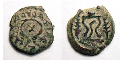
(شكل رقم 1)

http://www.wildwinds.com/coins/greece/judaea/herod_I/AJCII_236-8.jpg