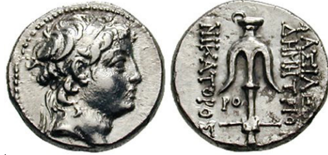
(شكل رقم 11)

http://www.wildwinds.com/coins/greece/seleucia/demetrios_II/Houghton_0567.jpg