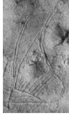
(شكل رقم 58)

http://www.ancientlyre.com/historical_research