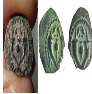
(شكل رقم 41)

https://sites.google.com/site/terryolmsted/index-6/chapter-262/judea