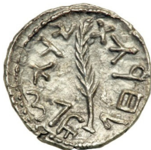
(شكل رقم 20)

http://www.icollector.com/Ancient-Jewish-Coinage-Bar-Kokhba-War-132-135-CE-AR-Denar-Zuz-2-98-g-attributed-to-year-3-134_i9764420