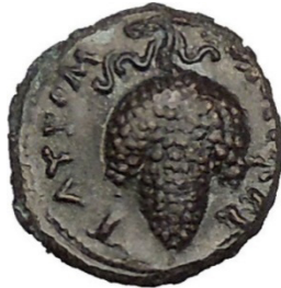
(شكل رقم 68)

/https://www.ebay.com/itm/TAUROMENION-in-SICILY-305BC-Apollo-Grapes-RA-RE-R2-Ancient-Greek-Coin-i51604-/351473671968