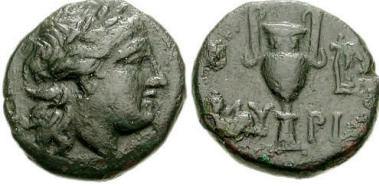
(شكل رقم 62)

https://www.cng-coins.com/Coin.aspx?CoinID=51480