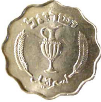
(شكل رقم 18)

http://www.holywordcafe.com/ebay/PRU-10-Pru-tot-front.jpg