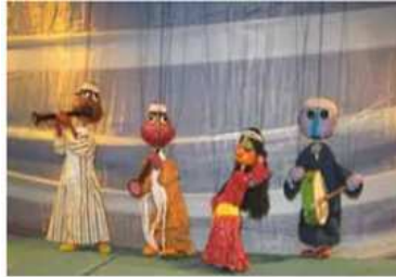
صورة رقم (5) توضح عرائس الماريونيت (عرايبي، 2018)

وهي العرائس التي تُحرك من خلال خيوط أفقية مثبتة في العروس من أسفل، ومثبتة بلوح خشبي من أعلى يتم تحريكها من خلاله، وتتميز بسهولة تحريكها، وتعكس حركات الإنسان مثل القفز، والتسلق والسباحة، والحركات الهوائية. (محمد وقنديل، 2015)