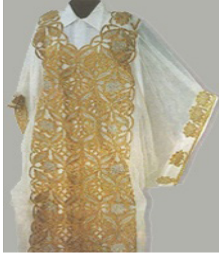
صورة رقم 1 ثوب درفة الباب (عليا مبروك، 1990)