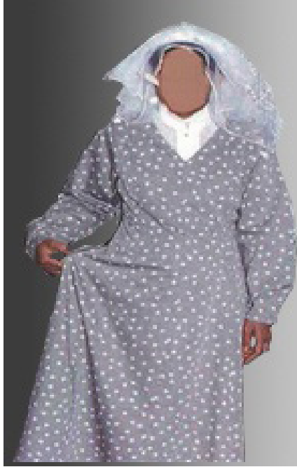
صورة رقم (3) أحد أشكال الكرتة (فاطمة الزنبيقي، 2018)

وهي تطور للزبون، أُطلق عليه لفظ كرتة (لفظة هندية)، حيث أصبحت حردة الرقبة تُخاط بعدة أشكال، قد يُضاف لها ياقة قلاب، أو دائرية، أو مثلثة، أو مرتفعة حسب الرغبة، كما استبدل الكم القصير بأخر طويل، وتميز الصدر إما بوجود بنستين في الصدر، وفي الوسط، أو بقصة برنسيس تبدأ من الثلث الأخير لحردة الإبط بشكل مستدير، وقد يُفصل الجزء العلوي عن السفلي بقصة عرضية، أما الجزء السفلي للكرتة فإما أن يتصل بشكل كلوش (نصف دائرة)، أو شقري ضيقة العرض من الوسط. وتنتهي باتساع في الطرف السفلي للكرتة، وتخاط الكرتة من الأقمشة المشجرة أو المنقطة، بالإضافة إلى أنها أصبحت تُرتدى في حضور المناسبات والأفراح؛ على أن تخاط من أقمشة ثمينة تلائم المناسبة التي تُرتدى من أجلها، وتتميز الكرتة بتعدد تصميماتها، واختلافها من منطقة لأخرى في المملكة.