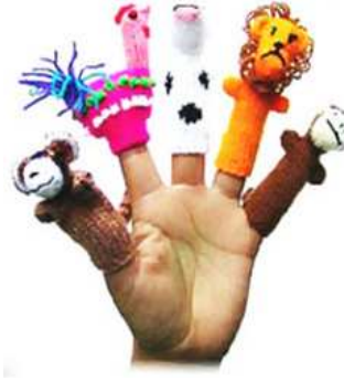
صورة رقم (4) توضح عرائس اليد. (الغزالي، 2013)

وهي التي تُرتدى كالفقاز ويتم تحريكها من خلال أصابع اليد.