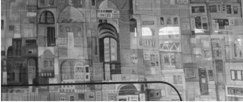
الشكل (8): جدارية مطار الملك عبد العزيز بجدة- المملكة العربية السعودية

تم تنفيذ عدد كبير من الجداريات الخزفية في مدينة جدة ضمن برامج رؤية المملكة 2030، الشكل (8)؛ إذ تعد مدينة جدة من أفضل ثلاثة مدن تنافسية في جودة الحياة، إلى جانب الارتقاء بالطابع الحضاري، وتحسين الرؤية الفنية لتحقيق مستوى عالٍ في الفن (مصطفى، 2021)