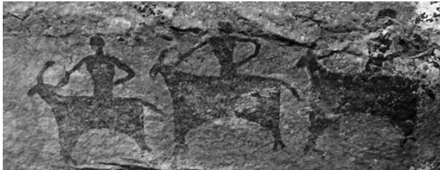
الشكل (1) رسم جداري يمثل الحياة اليومية في العصر الحجري

والفن الجداري يعد عملا توثيقيا لما يمر به الإنسان في حياته فهي تراث الشعوب وتاريخها وفكرها، وتحمل رسالة ثقافية من جانب وجمالية من جانب آخر. فقد كان الإنسان قديما يجسد كل ما يتعرض له على جدران الكهوف من أحداث متنوعة على هيئة أشكال ورموز، وهذا يؤكد على مدى الارتباط بين الإنسان وبيئته، كما يؤكد نشاطاته وإبداعاته وتوظيفه للرموز بشكل اجتماعي واقتصادي وعقائدي (عبد العزيز، 2018)