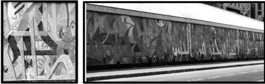
الشكل (6): جدارية مكة – للفنان سعود خان – المملكة العربية السعودية – 2014.

تعد الجدارية الخزفية للفنان سعود خان الموجودة في طريق الحرم المكي في مكة المكرمة من أكبر الجداريات الخزفية في المملكة العربية السعودية، الشكل (6). حيث تبلغ مساحتها 150م*3م، وقد تم تنفيذها بالطين بتقنية السيفساء، نظرا لقدرة الخزف على البقاء لفترة طويلة وسهولة تشكيله ومقاومته للعوامل الجوية والبيئة المحيطة به (مصطفى، 2021)