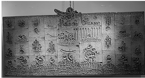
الشكل (2) جدارية خزفية بأسلوب البلاطات المنتظمة. للفنان رعد الدليمي، 2018.

هذا الأسلوب يستخدم بكثرة بين الخزافين، ويعتمد على تشكيل الجدارية الخزفية بشكل هندسي منتظم حيث يتم فرد الشريحة وباستخدام المساطر الخشبية يتم قصها بشكل منتظم وتركب بجانب بعضها مكونة لوحة متماسكة (رشدي، وآخرون، 2019)