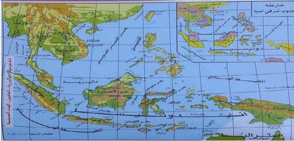
خريطة (1) جغرافية منطقة جنوب شرق آسيا (حميد 2021، 90).

ولذلك ينظر كثير من الباحثين والمتخصصين إلى الأهمية الجيوبوليتيكية التي تؤديها بعض المجالات، إذ تدعم هذه المجالات مشاريع القوى الدولية، وبهذا يمكن أن تستغل بعدها الاستراتيجي من أجل أن تفتح لها أفقاً جديداً للنهوض في سياق التفاعلات على المستويين الاقتصادي والسياسي وتحقيق الاعتراف الدولي بوصفه جزءاً من استراتيجيتها التي ترمي إلى تأمين مصالحها في تلك المنطقة.